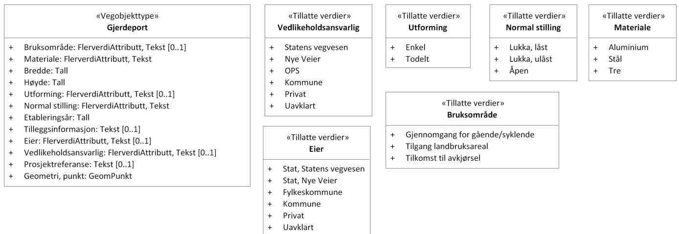
Figur 2: UML-skjema tillatte verdier