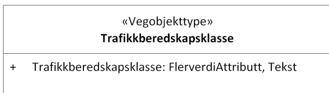
Figur 1:UML-skjema med betingelser