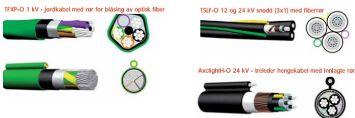
Figur 6: Kraftkabel med innlagt fiberrør

Kraftkabel med innlagt fiberrør kan øke verdien av nedlagt kabel fordi fiber enkelt kan blåses gjennom kabelen ved behov.