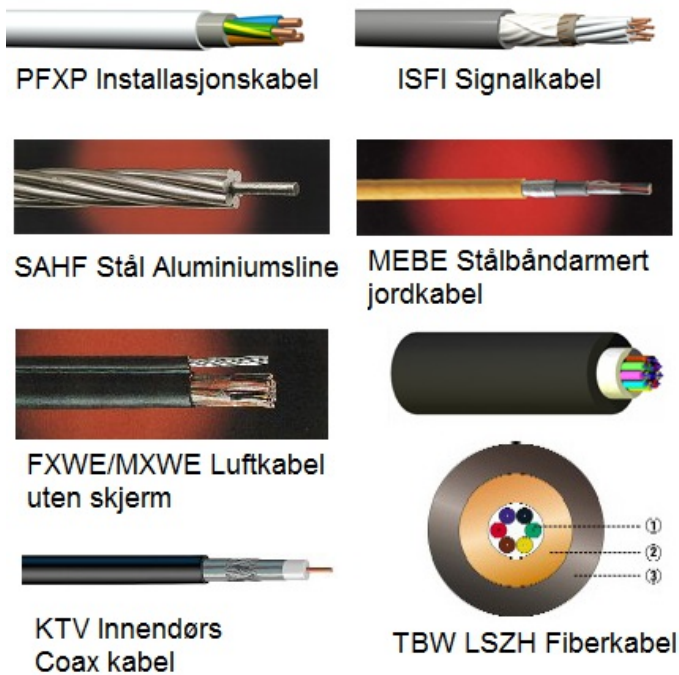
Figur 4: Eksempler på forskjellige typer kabel (fra Nexans)