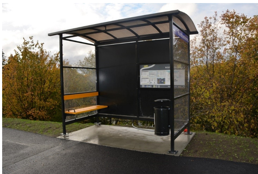
Figur 1 Leskur