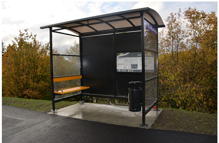
Avfallsdunk plassert i et leskur.

Antall: 1 Type: Avfallsdunk Tømmebehov: 1 Volum: 12