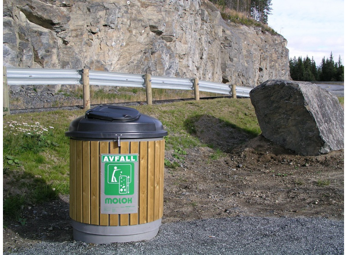
Molok på rasteplass.

Antall: 1 Type: Molok Tømmebehov: 1 Volum: 400