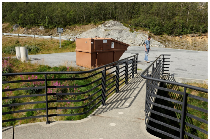
Avfallscontainer på rasteplass.

Antall: 1 Type: Avfallscontainer Tømmebehov: 0.5 Volum: 650