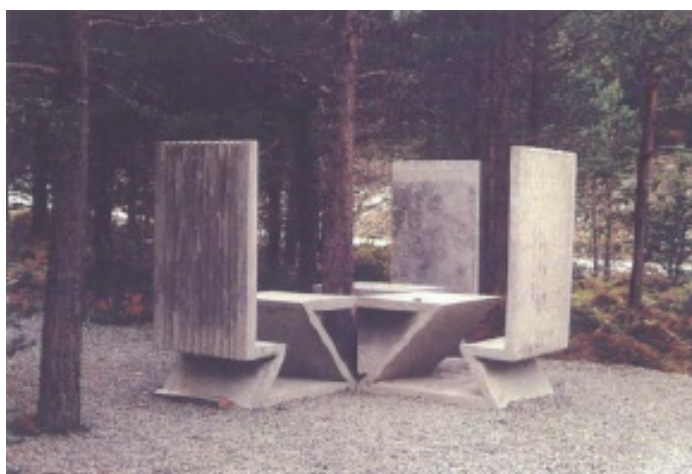
Sittegruppe, bord/stoler av materialtype betong