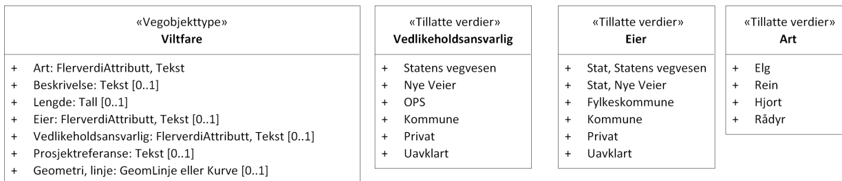
Figur 2:UML-skjema tillatte verdier