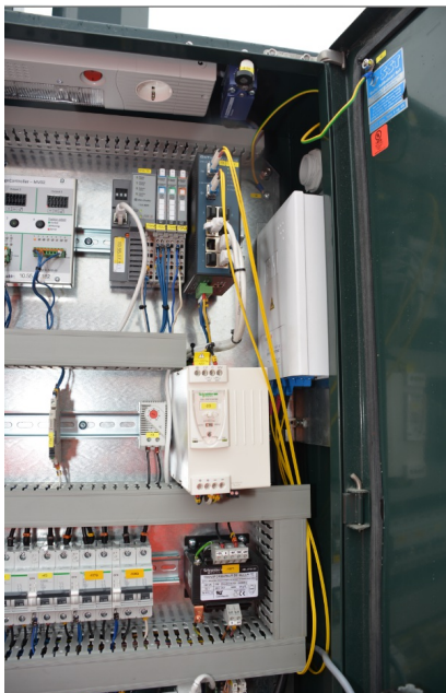
Måler plassert i fordelingskap.

Måleren er ofte plassert i en fordelingsstavle (skap). Her ligger gjerne også overspenningsvern, overbelastningsvern(automatsikringer) og mange andre typer utstyr.