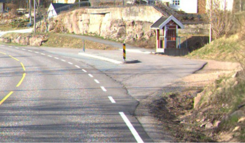
Eksempel 2. Trafikklorne - bruksomr ade busslorne