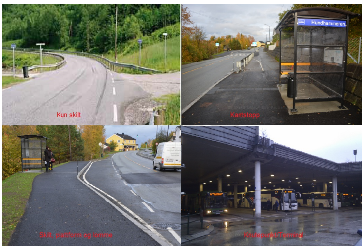
Typer av holdeplassutrustning

Bildet viser eksempler på typer Holdeplassutrustning. UU_Type : er definert slik her og i håndbok V123: