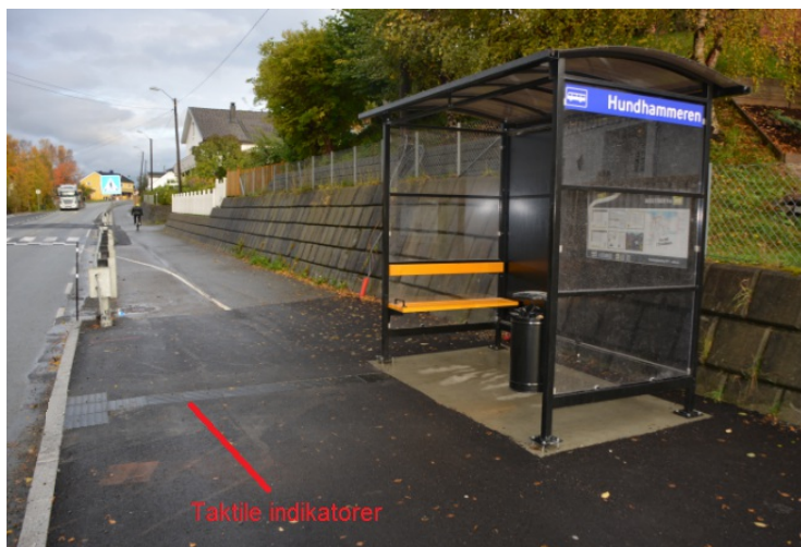
Taktile indikatorer ved busstopp.

Bildet viser eksempler på taktile indikatorer på en Holdeplassutrustning