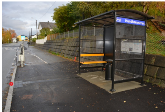
Geometriereferanse for objektet