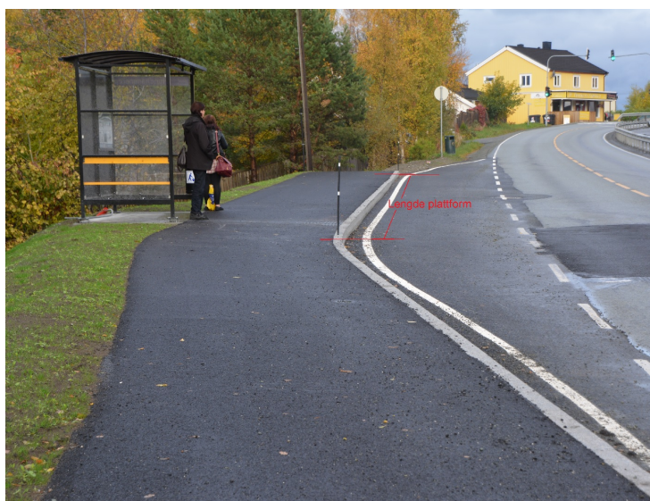
Lengde plattform.