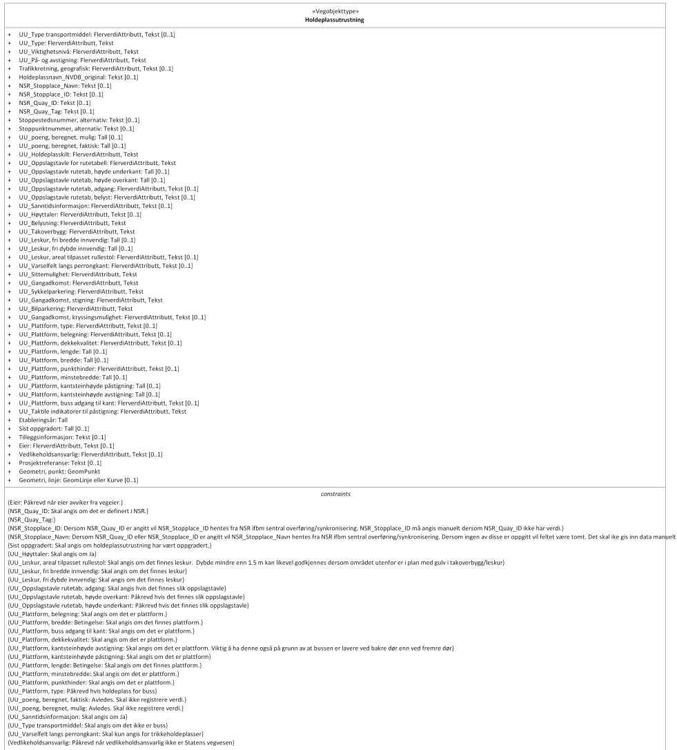
Figur 1:UML-skjema med betingelser