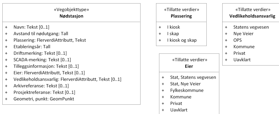
Figur 2: UML-skjema tillatte verdier