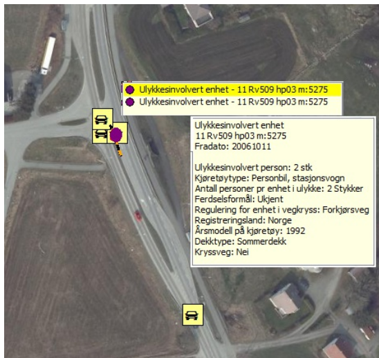
Figur 3: Data for ulykke med 2 ulykkesinvolverte enheter

Eksemplet viser data fra en trafikkulykke med to enheter involvert i ulykken. Vi ser her at det er to personer involvert i den ene bilen, og disse vil da finnes igjen som ulykkesinvolvert person.