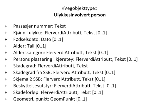
Figur 1: UML-skjema for Ulykkesinvolvert person