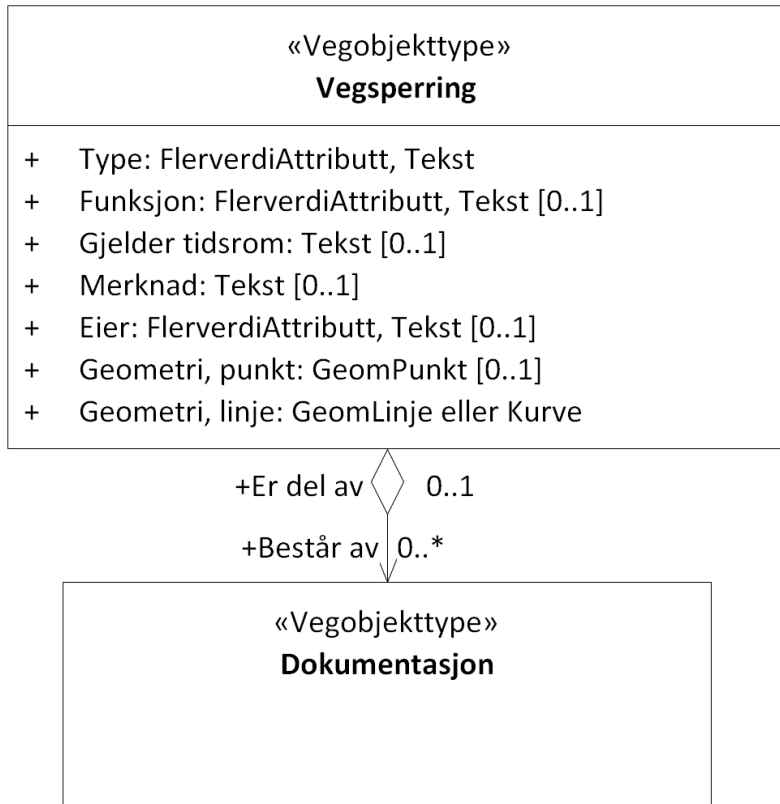
Figur 3: UML-skjema med assosiasjoner