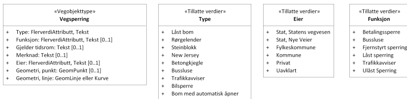
Figur 2: UML-skjema tillatte verdier