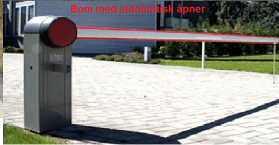
Bom med automatisk åpner