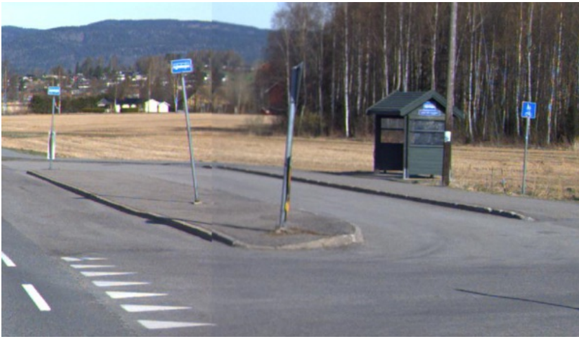
Figur 4: Eksempel på repos/venteareal på ensidig busslomme