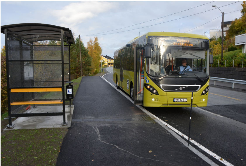
Figur 5: Eksempel på plattform ved busslomme (Hundhammeren i Malvik kommune).

Areal: 100 Belegning: Asfalt Bredde: 2,5 Lengde : 40 Type: Plattform