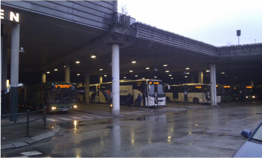
Figur 3: Repos/Venteareal på kollektivterminal

Bildet viser flere venteområder under tak i kollektivterminal.