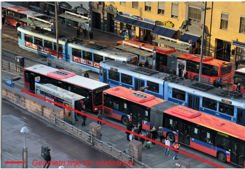
Figur 6: Flere Repos/Venteareal på kollektivknutepunkt