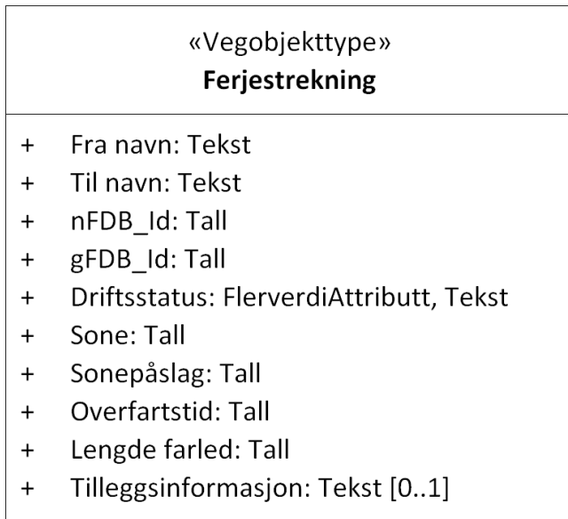
Figur 1: UML-skjema med betingelser