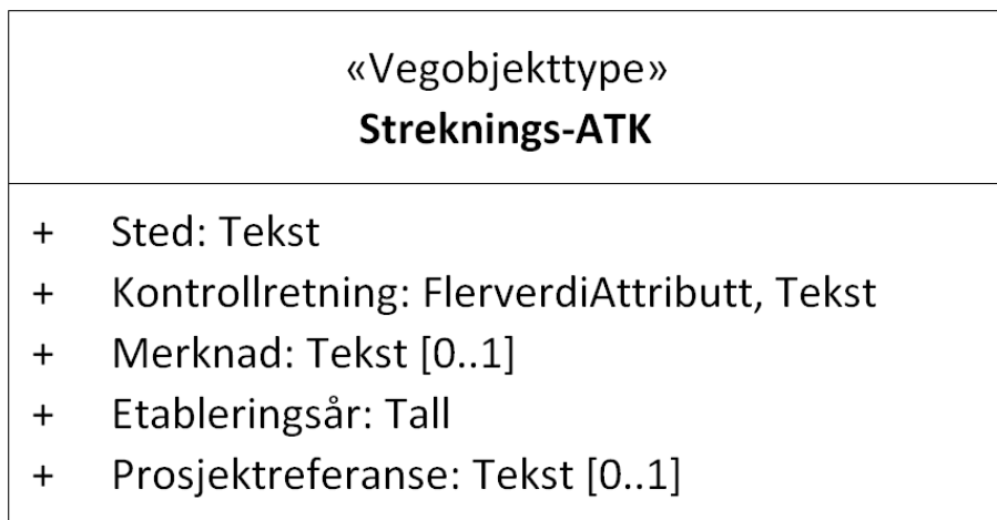
Figur 1: UML-skjema