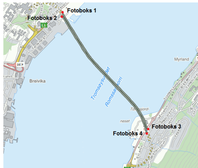
Streknings-ATK i Tromsøundet. Strekning registreres fra første til andre fotoboks i en retning.

Strekning 2 definert av fotoboks 2 og 4: E8 Hp07 10940-12988 Sted: Stakkevollan-Tomasjord Kontrollretning: Med metreringsretning