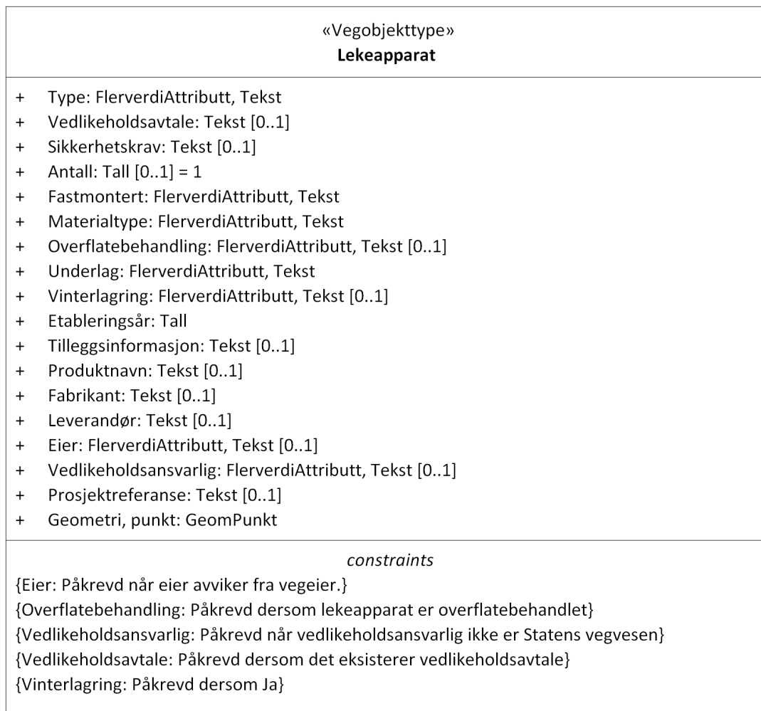
Figur 1: UML-skjema Lekeapparat