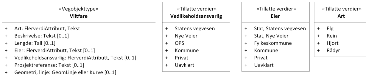
Figur 2:UML-skjema tillatte verdier