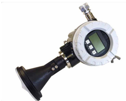
Vannstandsmåler med radar.

Bruksområde : Vannstand Driftsmerking : xxxxx Etableringsår : 2010 Produktnavn : H-3611-S SDI-12 (opsjonell) Produsent : Waterlog (opsjonell) Type : Radarsensor (opsjonell)