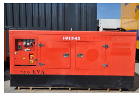
Stasjonært strømaggregat.