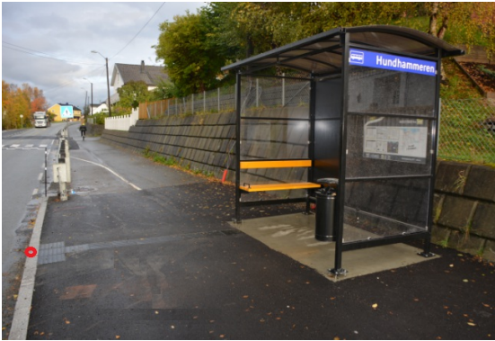
Geometrireferanse for objektet