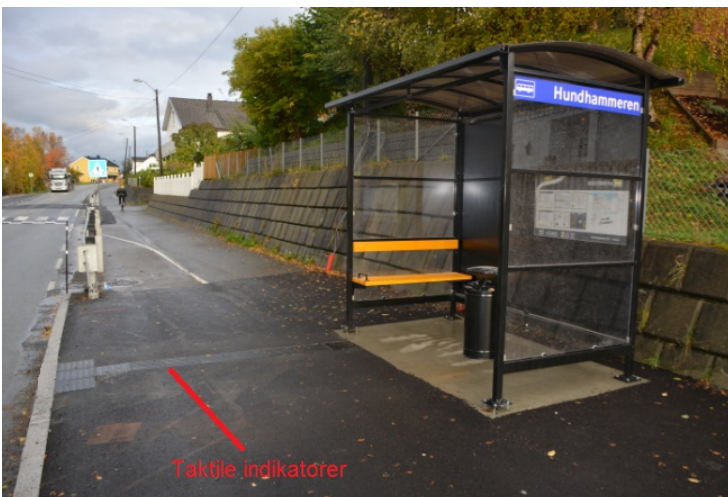
Takile indikatorer ved busstopp.

Bildet viser eksempler på takile indikatorer på en Holdeplassutrustning