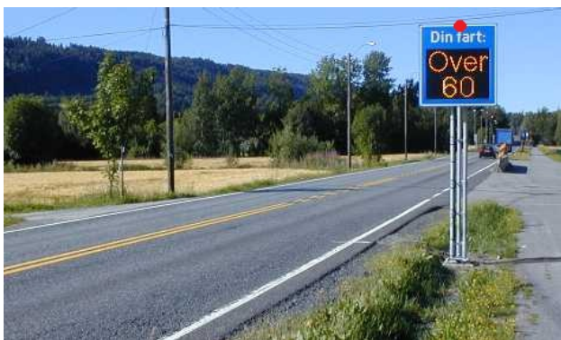
Fartstavle måles inn i senter topp tavle som vist her med rød prikk

Stasjonering : Fast Type måling : Sløyfe Produksjonsår : 2008 (opsjonell) Produktnavn : Fartstavle med Datarec 7 (opsjonell) Driftsmerking : Tavle3