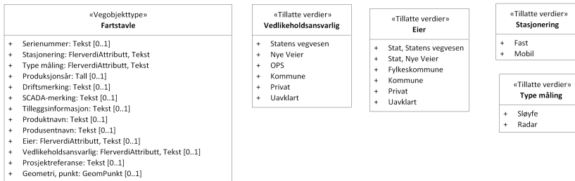
Figur 2: UML-skema tillatte verdier