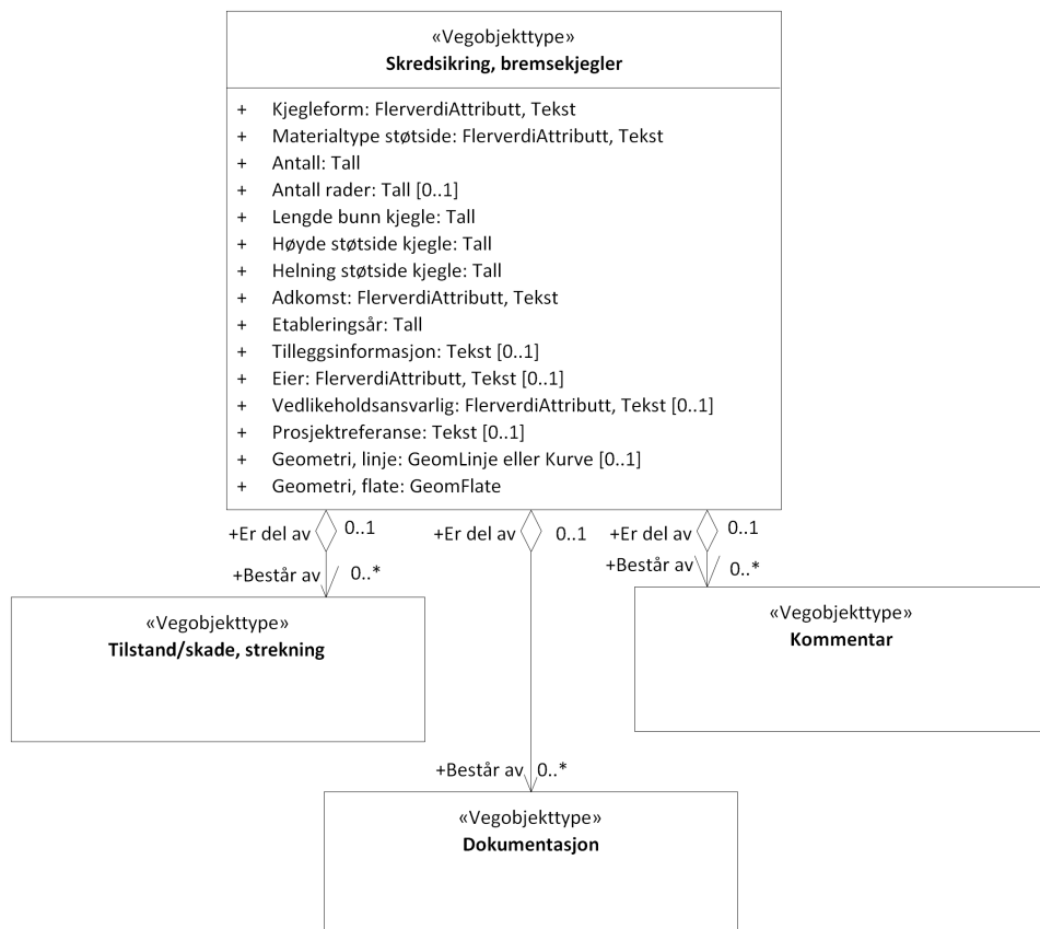
Figur 3: UML-skjema med assosiasjoner