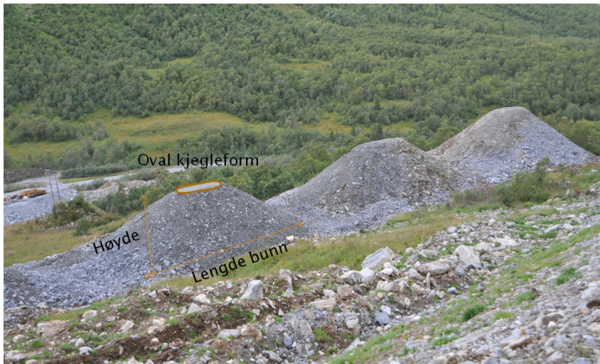
Figur 4: Eksempler på bremsekjegler sett ovenfra.