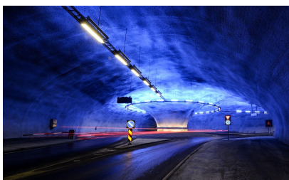
Lyssetting i Vallaviktunnelen.

Bildet viser eksempel på en moderne og litt spektakulær lyssetting i en rundkjøring i Vallaviktunnelen. For å kunne skille ut effektbelysning kan det være lurt å registrere noen av de opsjonelle egenskapene som Fargetemperatur