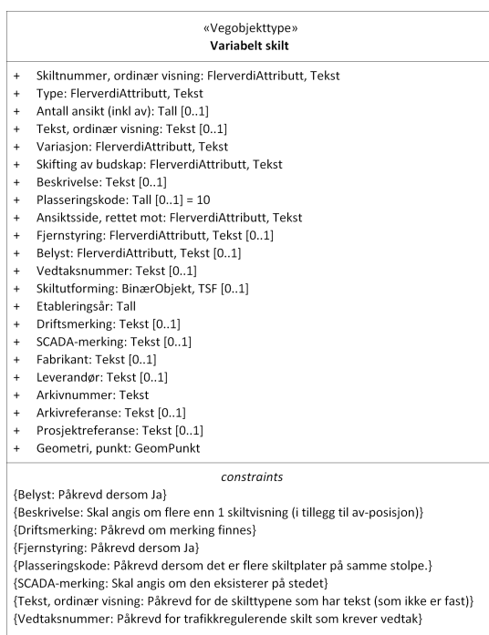
Figur 1: UML-skjema Variabelt skilt