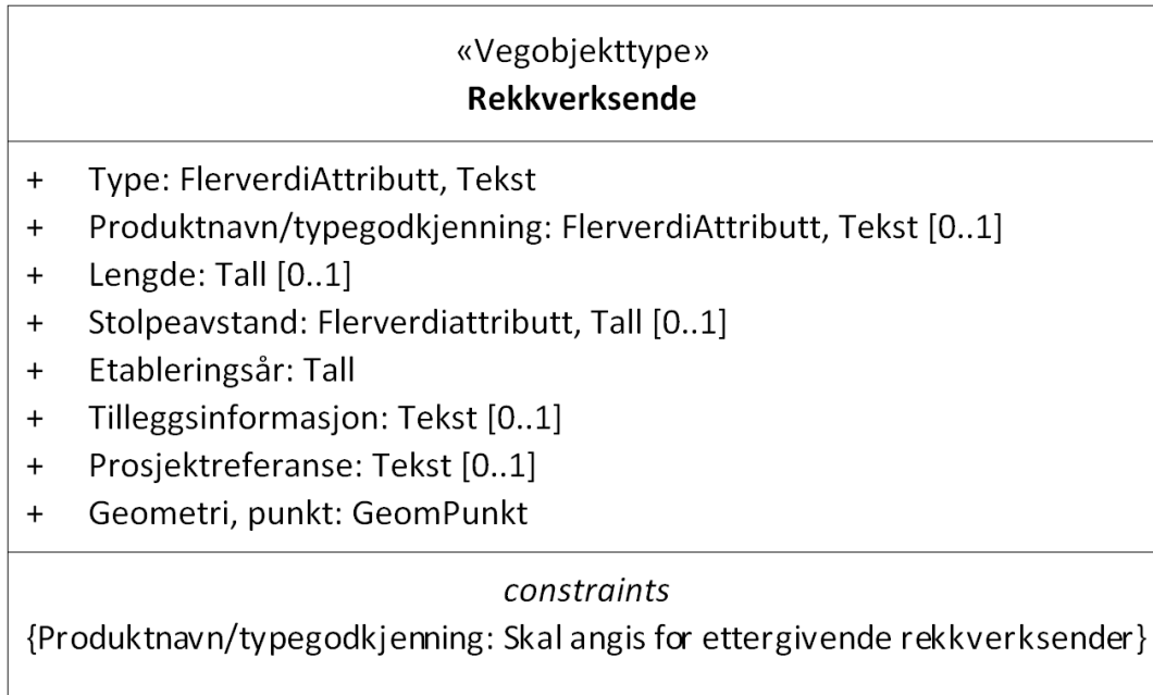
Figur 1: UML-skjema for Rekkverksende