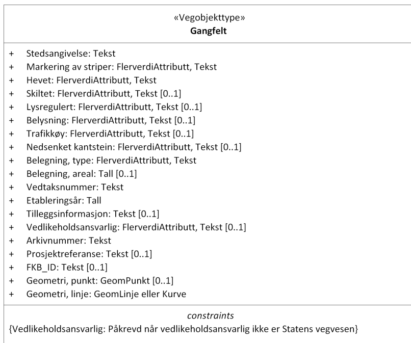
Figur 1: UML-skjema med betingelser