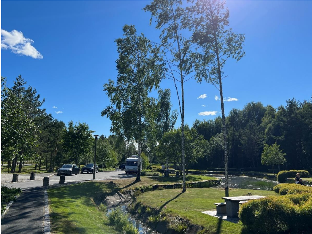
Figur 1 Østerholtheia rasteplass