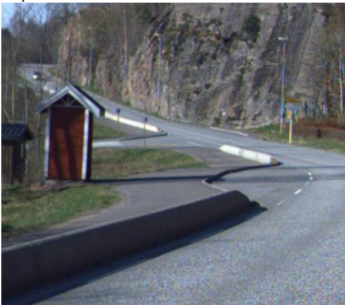
Eksempel 1. Trafikklokke - bruksområde busslokke