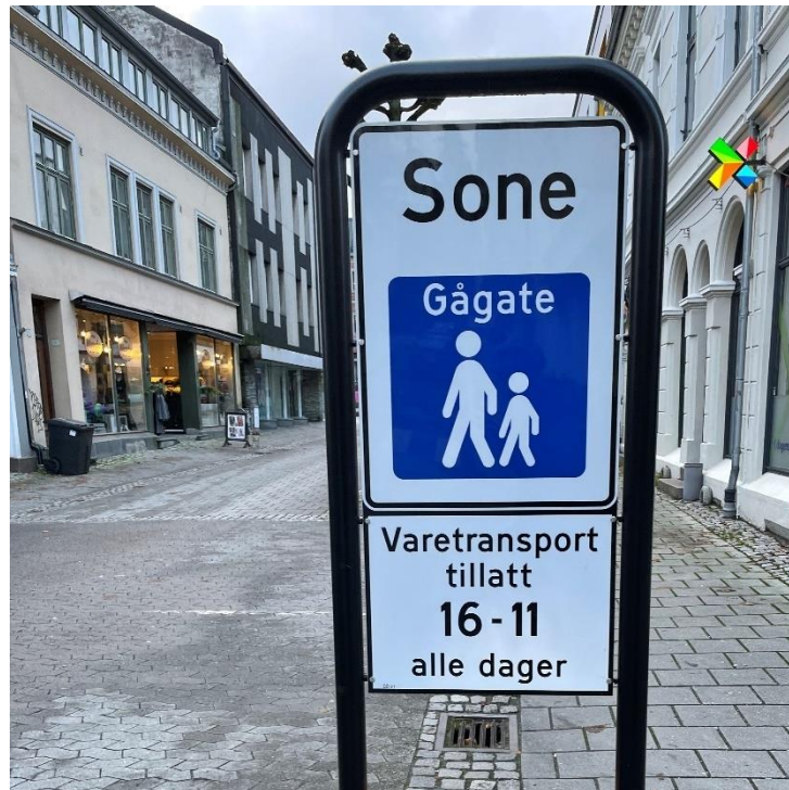
Figur 1 Gågate