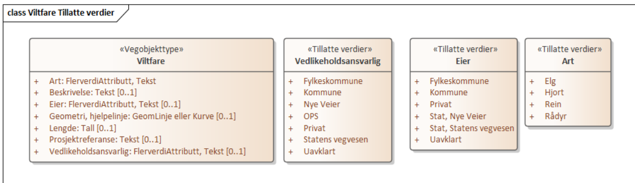
Figur 2:UML-skjema tillatte verdier