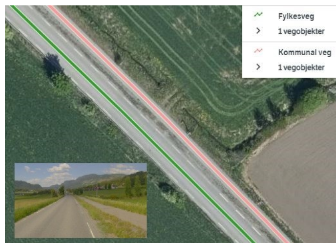
Figur 1 Kommunal gang- og sykkelveg langs fylkesveg 2522 i Øyer