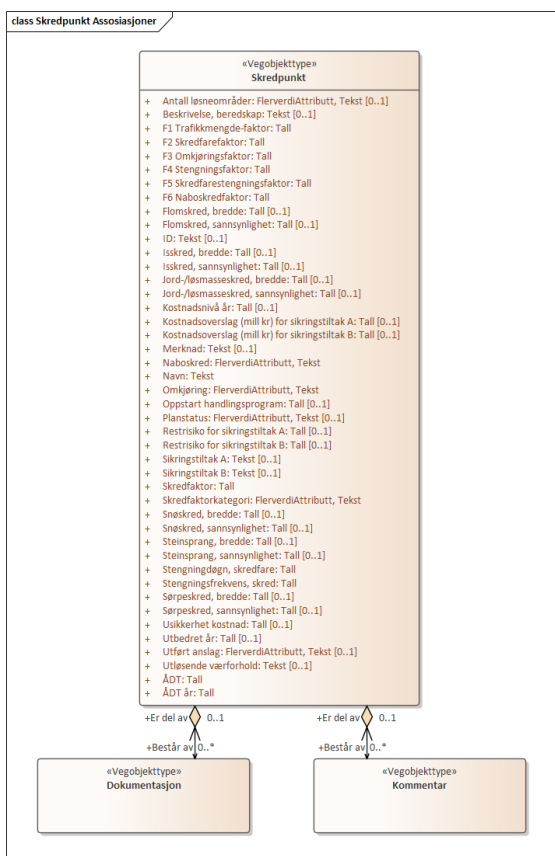
Figur 3: UML-skjema med assosiasjoner