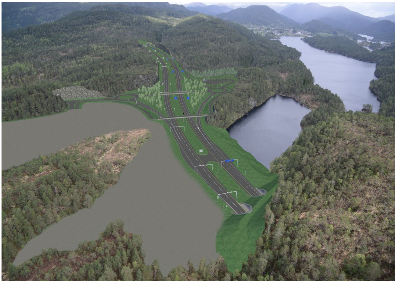
Figur 1 Veganlegg