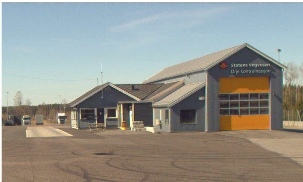
Figur 1 Ørje kontrollstasjon