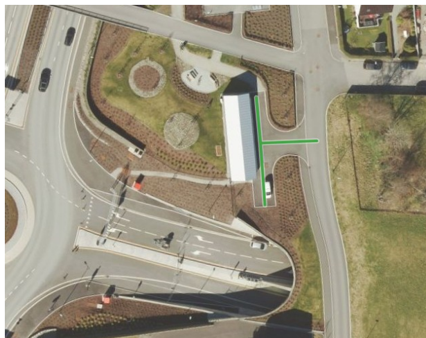
Figur 1 Serviceveg ved rv. 13 Hundvåg tunnelen