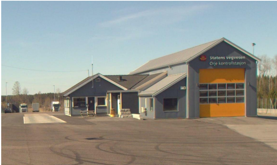
Figur 1 Ørje kontrollstasjon