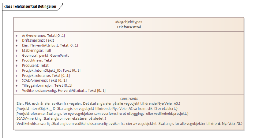
Figur 1: UML-skjema med betingelser