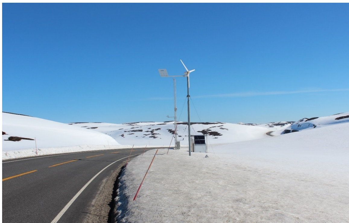
Figur 1 Værstasjon Ifjordfjellet