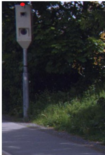
ATK-punkt måles inn i senter topp fotoboks som vist her med rød prikk

Navn: Kråkstad vest ID nummer: 021234 Kontrollretning: Med metreringsretning