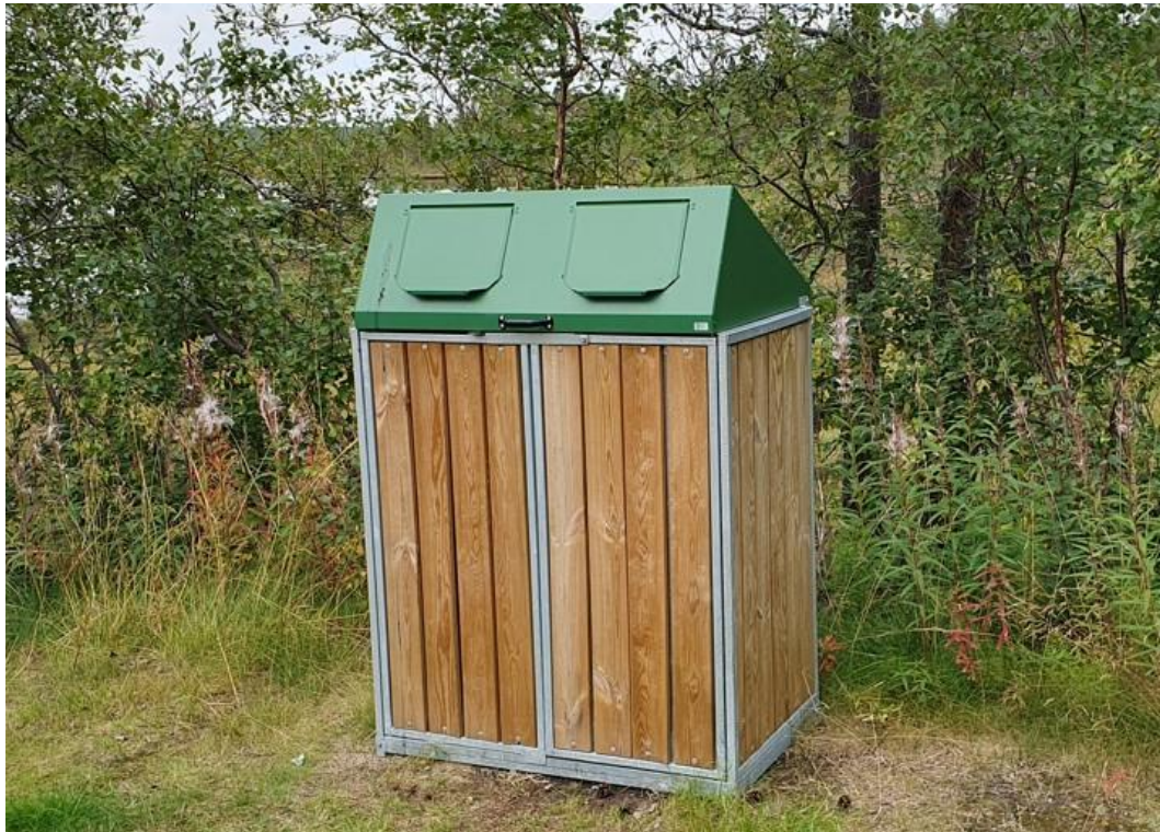
Figur 1 Renovasjon