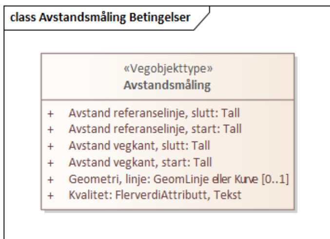
Figur 1: UML-skjema Avstandsmåling