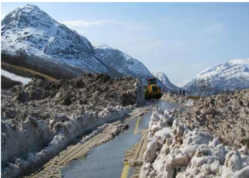
Sørpeskred, E6 Langfjorden, Finnmark, 16.05.2010 (Håndbok 139)

Vegreferanse: 1800 EV6 HP11 ml3000 – 17120