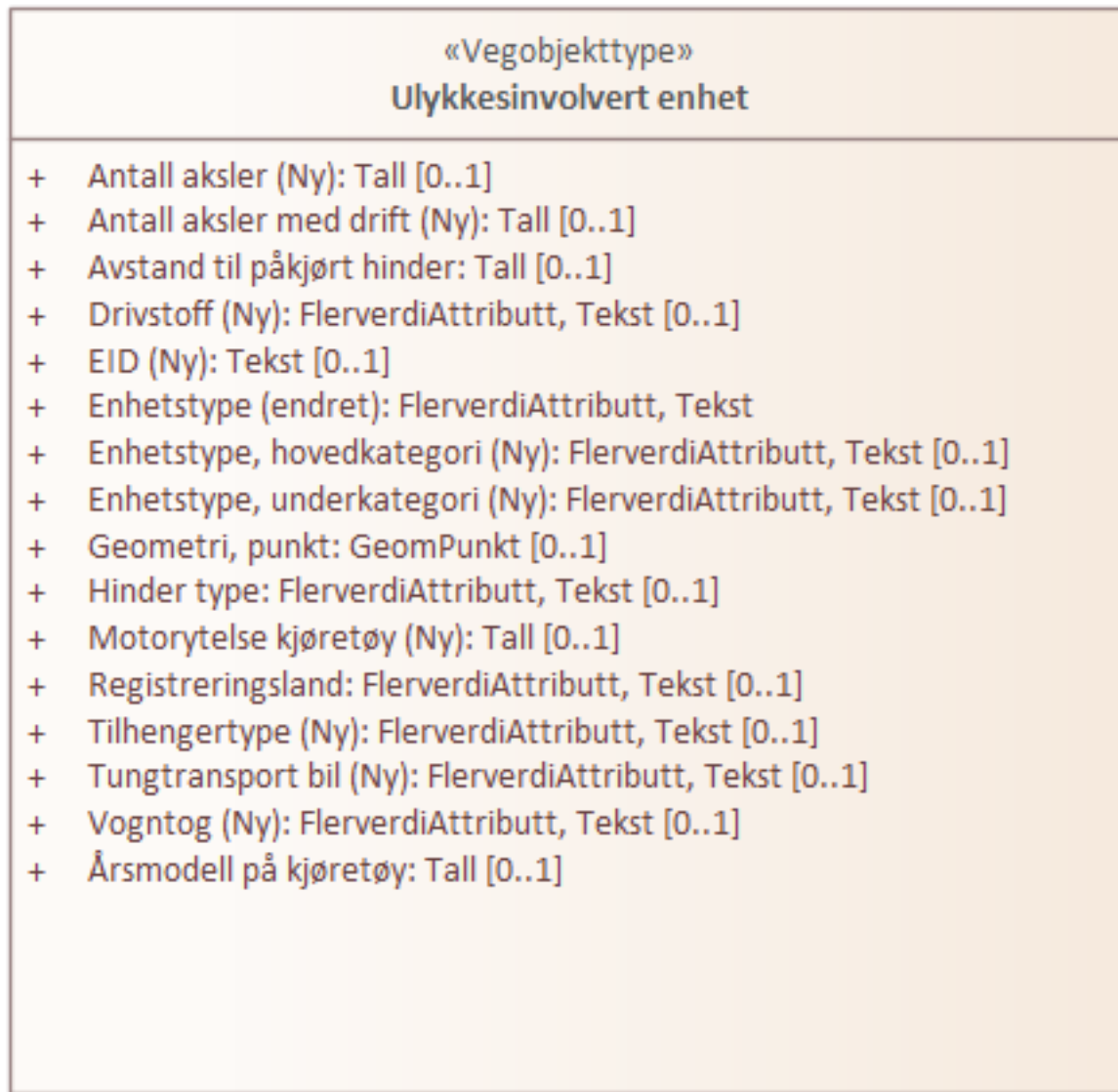
Figur 1: UML-Skjema for Ulykkesinvolvert enhet