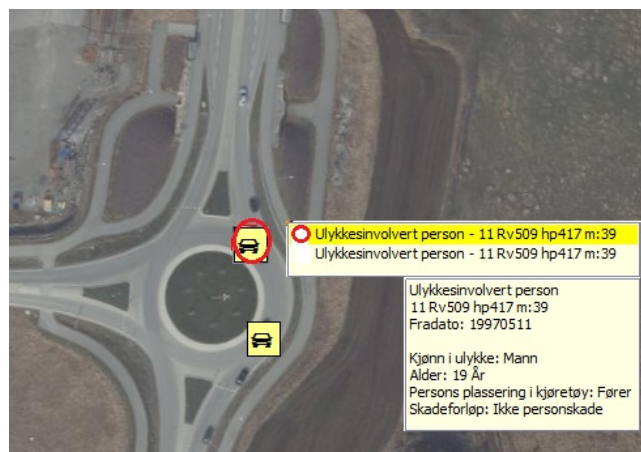
Figur 3: Data for en ulykkesinnvolvert person

Her vises data for den ene av to ulykkesinnvolverte personer i en ulykkesinnvolvert enhet