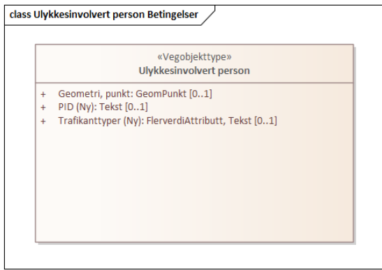
Figur 1: UML-skjema for Ulykkesinvolvert person