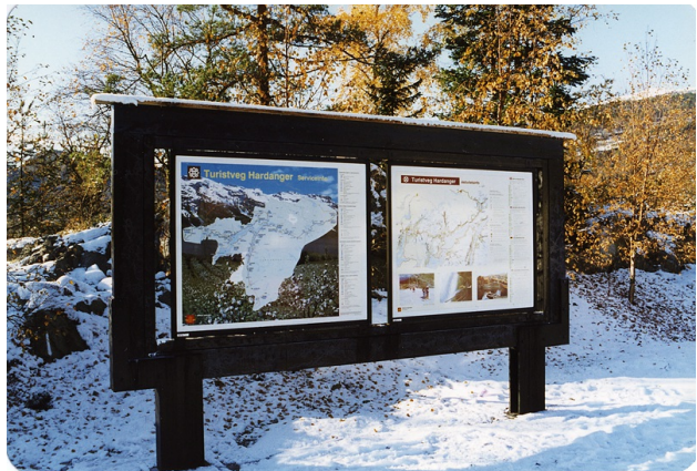
Stativ for turistinfo i Hardanger.

Antall infoplater : 2 Belyst : Nei Fundamentering: Stolpefundament Materialtype: Metall Overflatebehandling: Ubehandlet Plexiglass utenpå infoplater: Nei Stedsangivelse: Stegabakken Tak: Nei