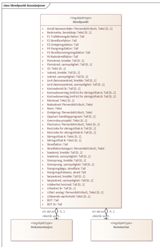
Figur 3: UML-skjema med assosiasjoner