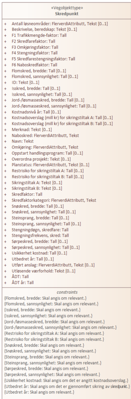
Figur 1: UML-skjema med betingelser