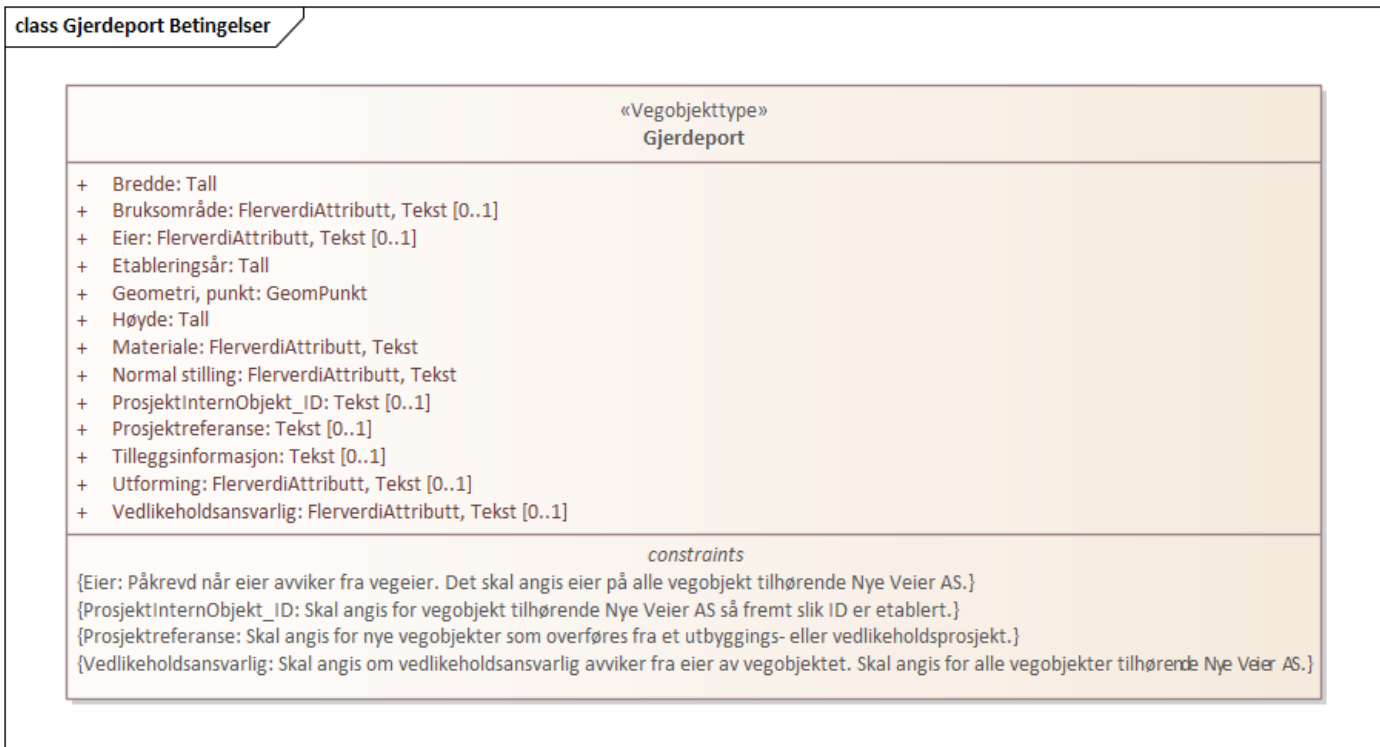
Figur 1: UML-skjema med betingelser