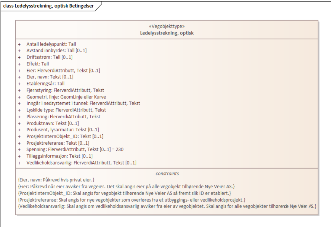
Figur 1: UML-skjema med betingelser